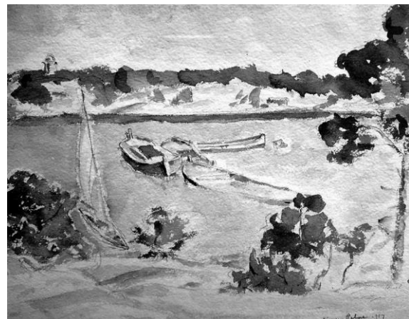
Två målningar av Einar Palme där hans neptunkryssare Après Vous finns med.