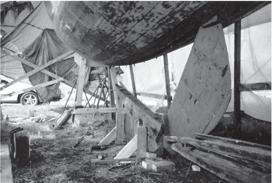
Fyran utan köl.