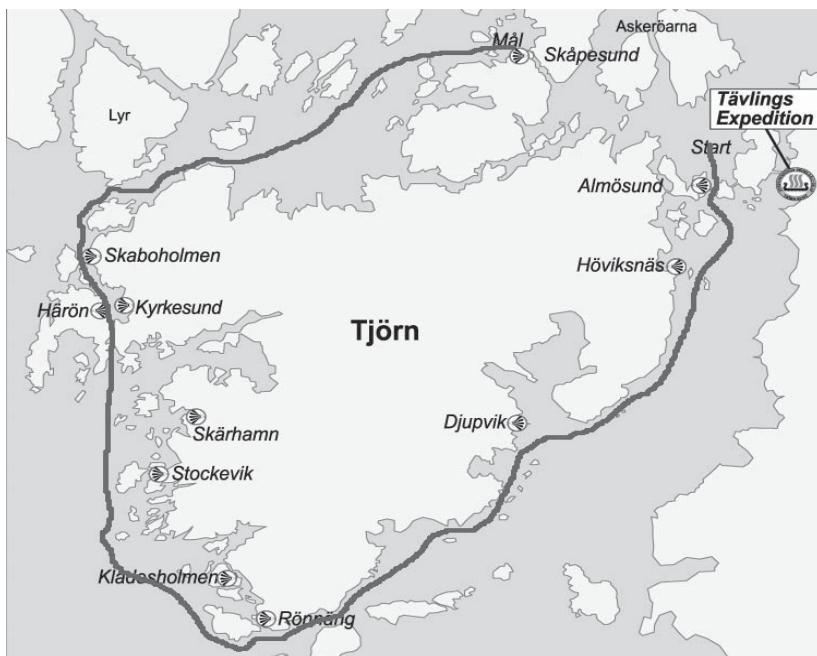
Bilden visar vägen runt Tjörn för Sjöfröken II.