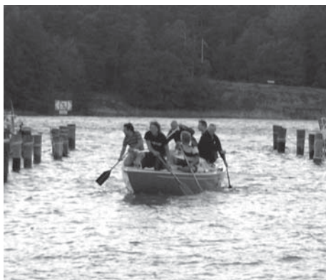
Paddling till mastkranen.

Självfallet är det sjöställ på och allt som inte mår bra av att bli blött borde ha lämnats i land eller lagts i plastpåsar. 117 och 253 väljer att inte starta pga. av den hårda vinden. Själva går vi ut med genuan satt men när vi går ut mot startområdet väster om Stenungsön och får våra första nerklapp så väljer vi att byta ner till kryssfock vilket kanske är en chansning. Ingen har väl i modern tid seglat kryssfock på en Neppare med gott resultat. Vi tycker ändå det kan vara läge att försöka – inte minst för att få bättre sikt och manövrerbarhet när vi ska segla tillsammans med 750 andra båtar de 27,5 nautiska milen