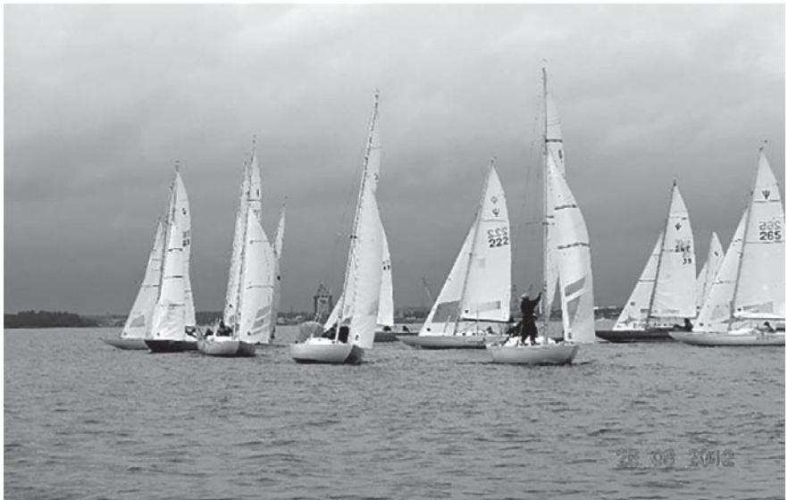
Från SM-seglingarna i Gävle 2012

Mer information kommer på hemsidan och i nästa Nepparnytt.