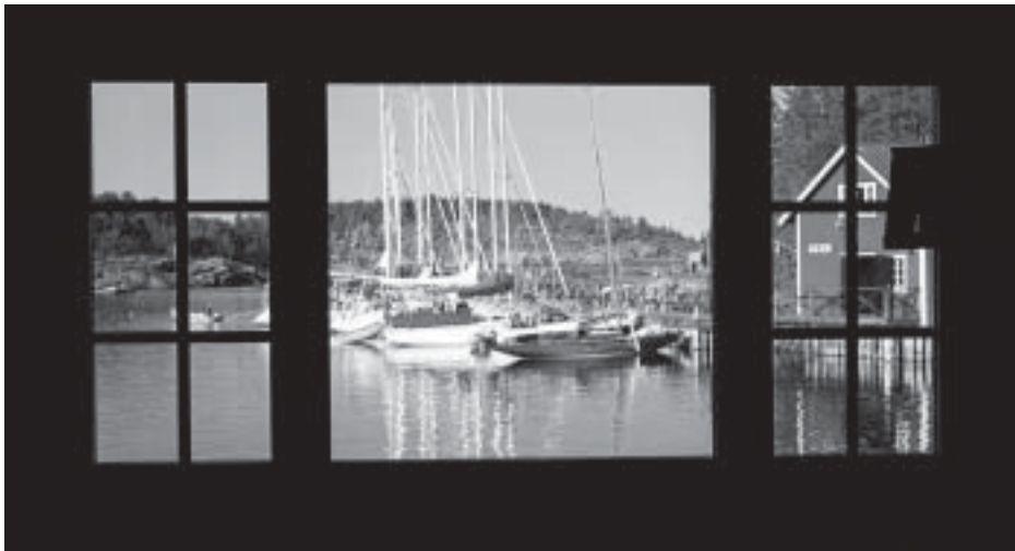
Utsikt från Arnes Krog i Bönhamn

Måndag kl. 11.00 styrdes kursen åter mot norr, till Sveriges högsta ö. Vi seglade i lätta vindar i strålände sol, med bedårande vackra vyer runt omkring oss var vi än skådade. Blånande höga öar vid horisonten och ett vackert milt dagsljus fick mig att utbrista “Detta måste vara paradiset” då vi seglade med spinnakern uppe, med den värmande solen i ryggen och endast sett två segelbåtar på långt avstånd under fyra timmars seglats från Bönhamn. Vi ankrade upp i den lilla runda östra viken på Mjältön som har ett mycket moderat vattendjup på endast 3 m.