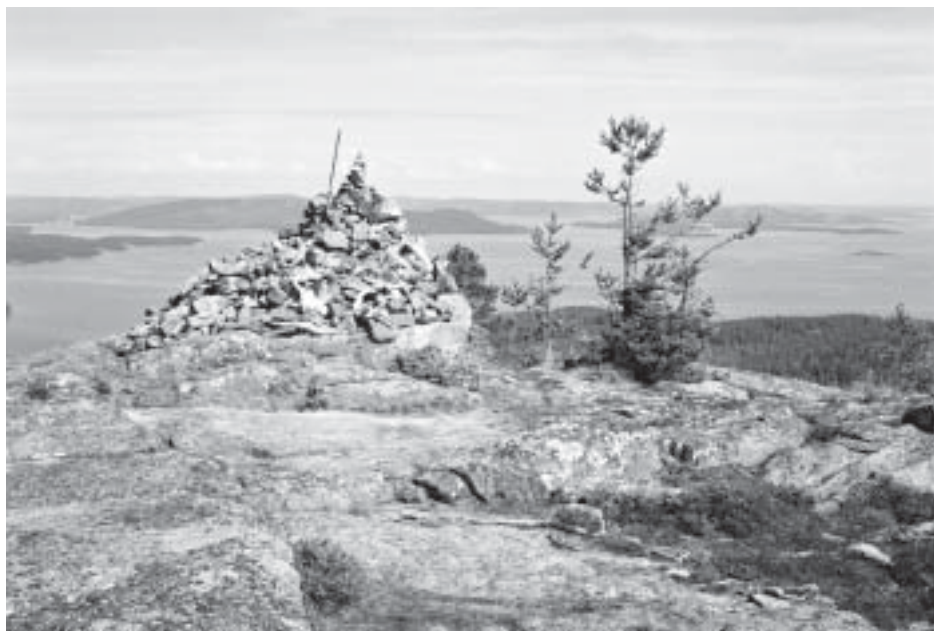
Mjältön - Sveriges högsta ö - 236 m

Onsdag. Promenad till Konsum centralt i brukssamhället för att proviantera, man måste ju ha mat för dagen också. Något fiske brukar jag aldrig hinna med, tiden går åt till att segla, vika segel, laga mat, fotografera, och titta på natur m.m. I dag hade vi en fin bris på kryss ut från Köpmanholmen som faktiskt är ett samhälle i en vik och inte en holme! Namnet förpliktigar ju inte i detta sammanhang. När vi var tvärs Järvöns södra spets blev det en stunds stiltje och efter en stund vred vinden från OSS till VNV. Vår seglats fortsatte några distansminuter till Vågöns stora västliga vik där vi beslöt att lägga till. Vi fick där en härlig kväll i det fina kvällsljuset i bra lä för den nordostliga och nu ganska hårda byiga vinden. Det enda lilla problemet var att jag var tvungen att vada sista biten för att förtöja Tonita med anledning av att det grundade upp