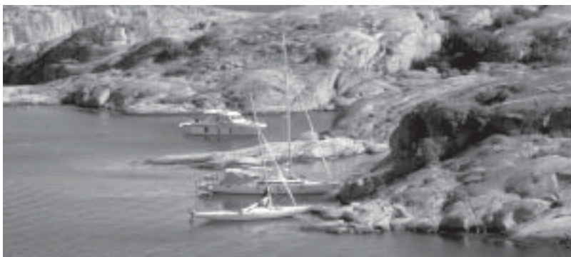
Vy från Gluppö utanför Fjällbacka