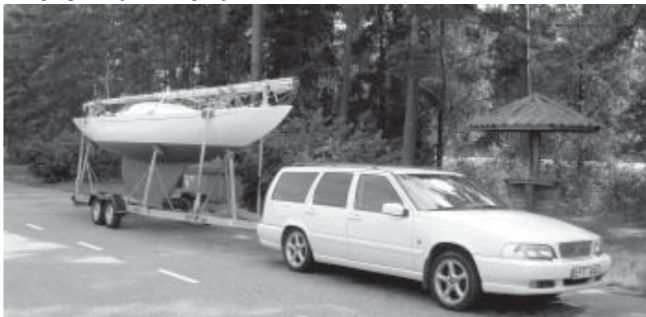
På väg till Västkusten och Tjörn Runt 2005