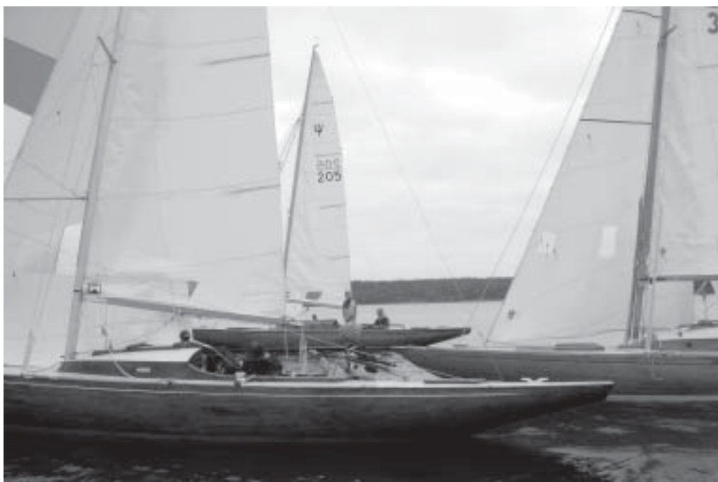
Träbåtssamling på Höst-Rasta 2006