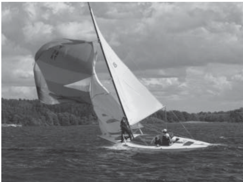
Det var friska vindar på Tune-Open