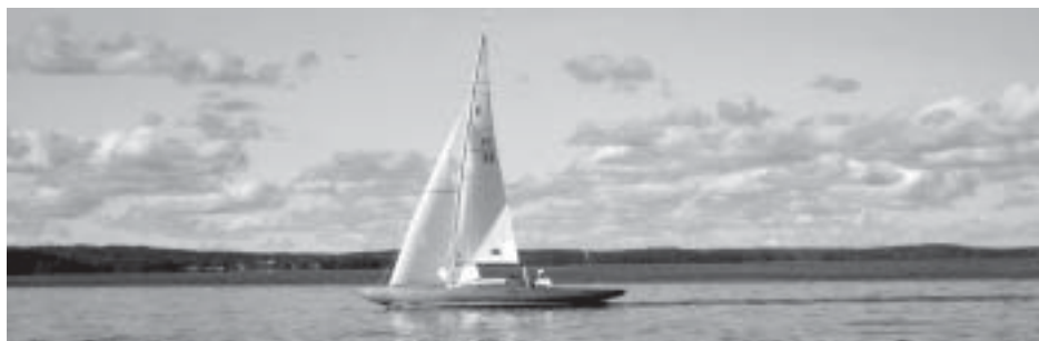
Tonita på lugna vatten.....

Efter det var det läge att sova i Tonita. “det går faktiskt att sova i Neptunkryssaren också, det verkar många ha glömt bort ! “ Söndagen den 16 september genomfördes tre delseglingar med nio startande Neptunkryssare. Efter seglingens slut så