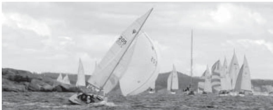
På Tjörn Runt blåste det ordentligt