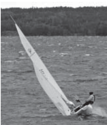
Nisse och Roger testar revet på Björken