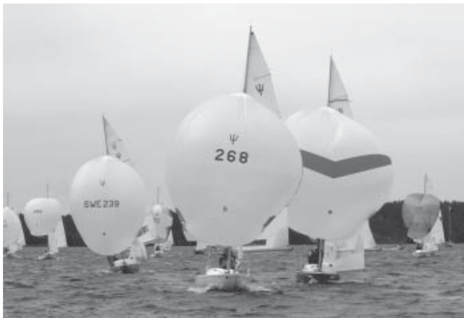
268 ledde länge SM...