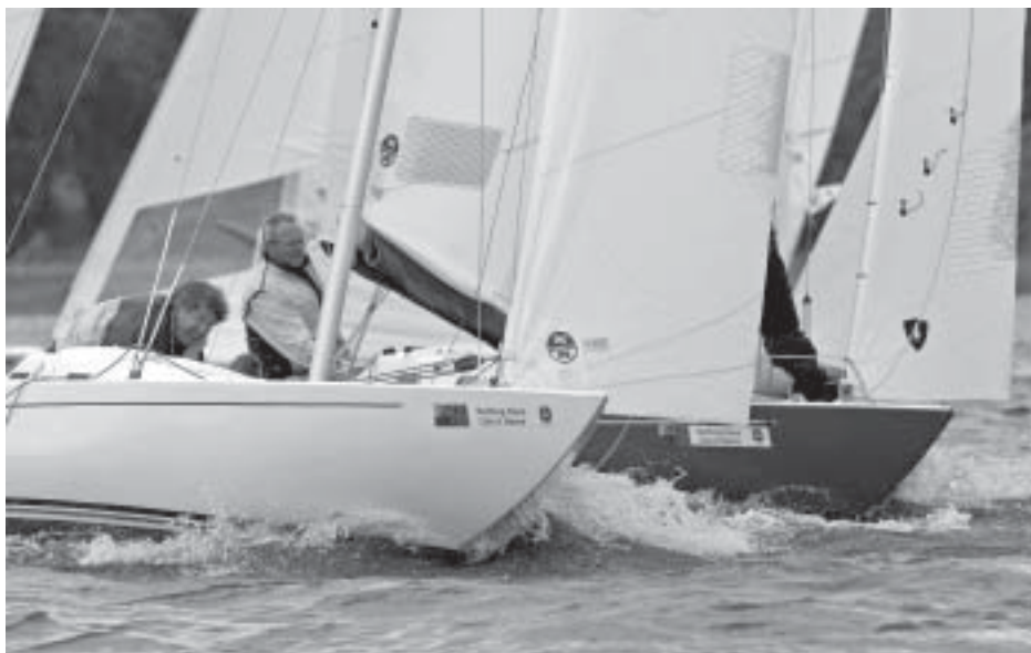
Har Lefte mönstrat på hos Jerry?