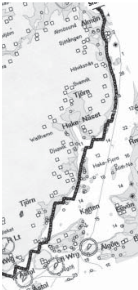
Plotterspåret från start och ner till Rönning. Mycket sågande vid land!

Taktiken var från vår sida att till skillnad från de flesta av våra konkurrenter försöka