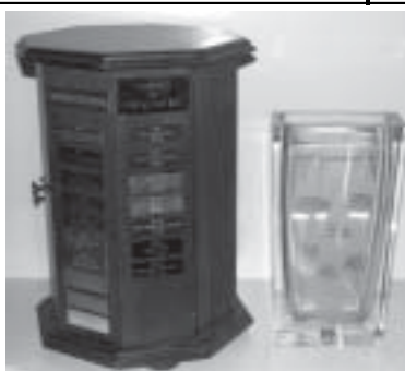
Vinnarna av Neptun Cup 2007 - Björn Bostedt och Tomas Persson