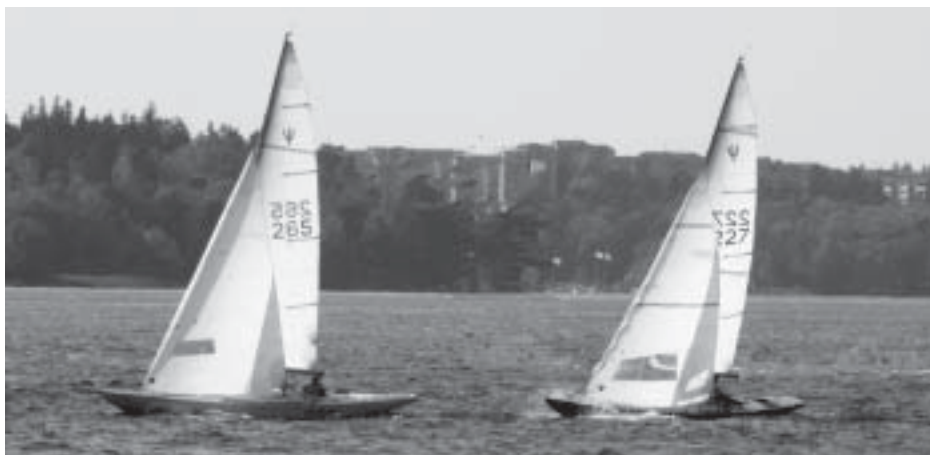
Tufft mellan 265 och 227 i målgången på Lidingö Runt