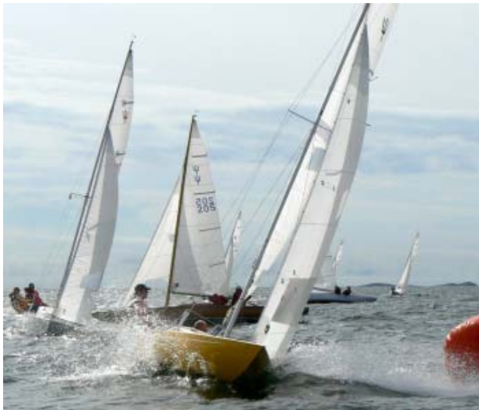
239 Banana Split spikade mest på SM

Även om startfältet inte var så stort som förväntat så var kvaliteten desto högre. Flera mycket meriterade kölbåtsseglare från andra klasser har ju bytt till Neppare eller börjat segla Neppare vid sidan av sin “vanliga” klass. Här fanns t.ex. flerfaldiga Svenska Mästare i Safir, IF, M30 och Rival 22 på startlinjen utöver alla de med SM-tecken i Neppare. Räknade man efter så var