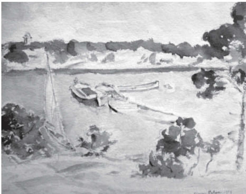
Tavla av Einar Palme med Aprés Vous i förgrunden. Vandringspris i Neptunkryssarförbundet, erövat för alltid av Valter Saaristu 1981.

Paret Palme ägde “Aprés Vous” fram till början av 1960-talet då de sålde båten till Sigtuna. S1 “Aprés Vous” förföll sedermera och var i sådant skick att båten eldades upp i början av 1970-talet.