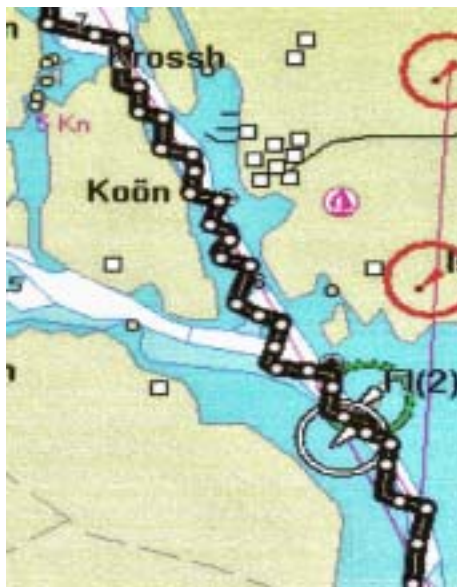
Detalj norr om Kyrkesund