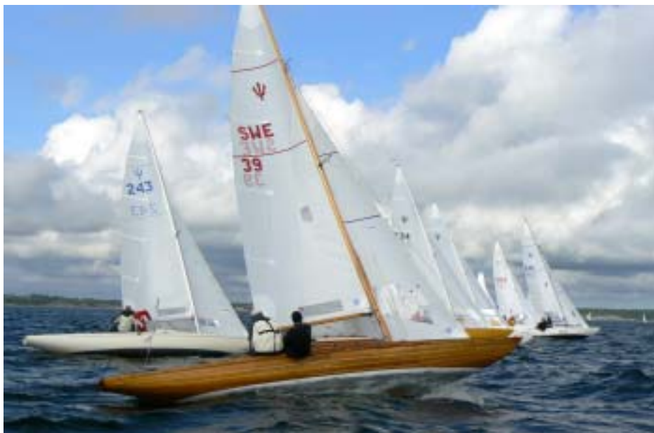
39 Tonita gjorde som vanligt bra starter