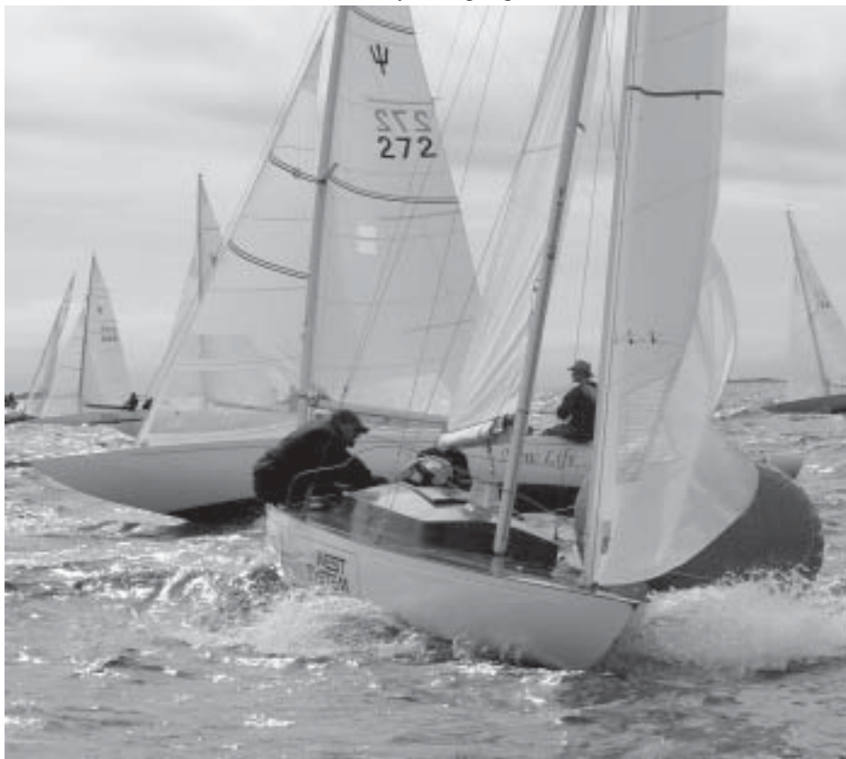
180 Kokett seglade tigt vid rundningarna