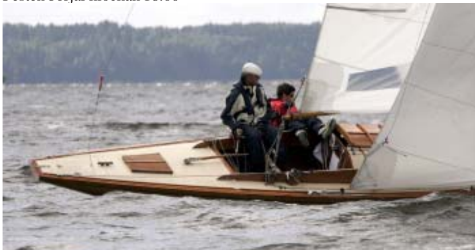
Nr 39 Tonita byggd 1943 på Williams varv i Motala