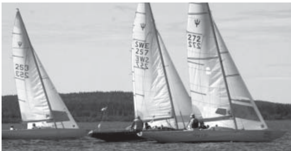
Lätta vindar i seglingarna om Neptunkryssarpokalen