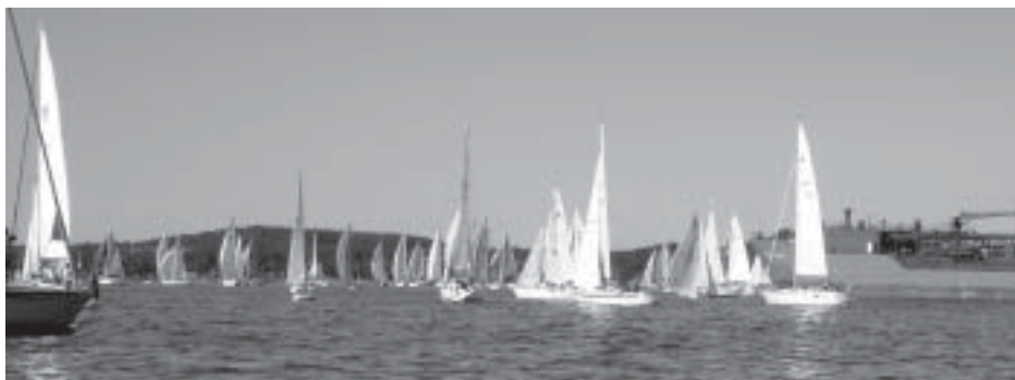
Lastbåten på gång genom startfältet

kunde segla fortare än någon annan eftersom de som låg sist kom länsande in i bröten med fyllda spinnakrar medan de som låg längst fram då och då fick en pust rakt framifrån och försökte börja kryssa. Den här bröten insåg vi att vi aldrig skulle kunna komma ur om vi fortsatte framåt. När alla bar av så bad vi faktiskt konkurrenterna att skjuta oss bakåt (och sig själva framåt) eftersom vi efter ett tag insåg att enda chansen att komma loss var att backa sig ut ur bröten.