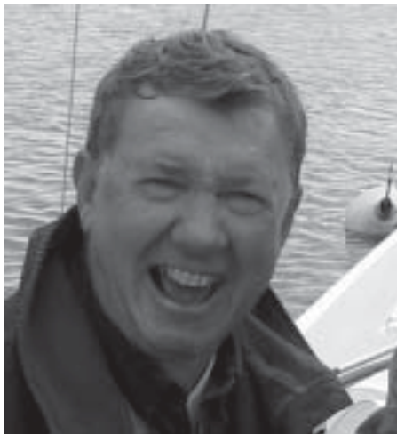
En glad ordförande efter SM