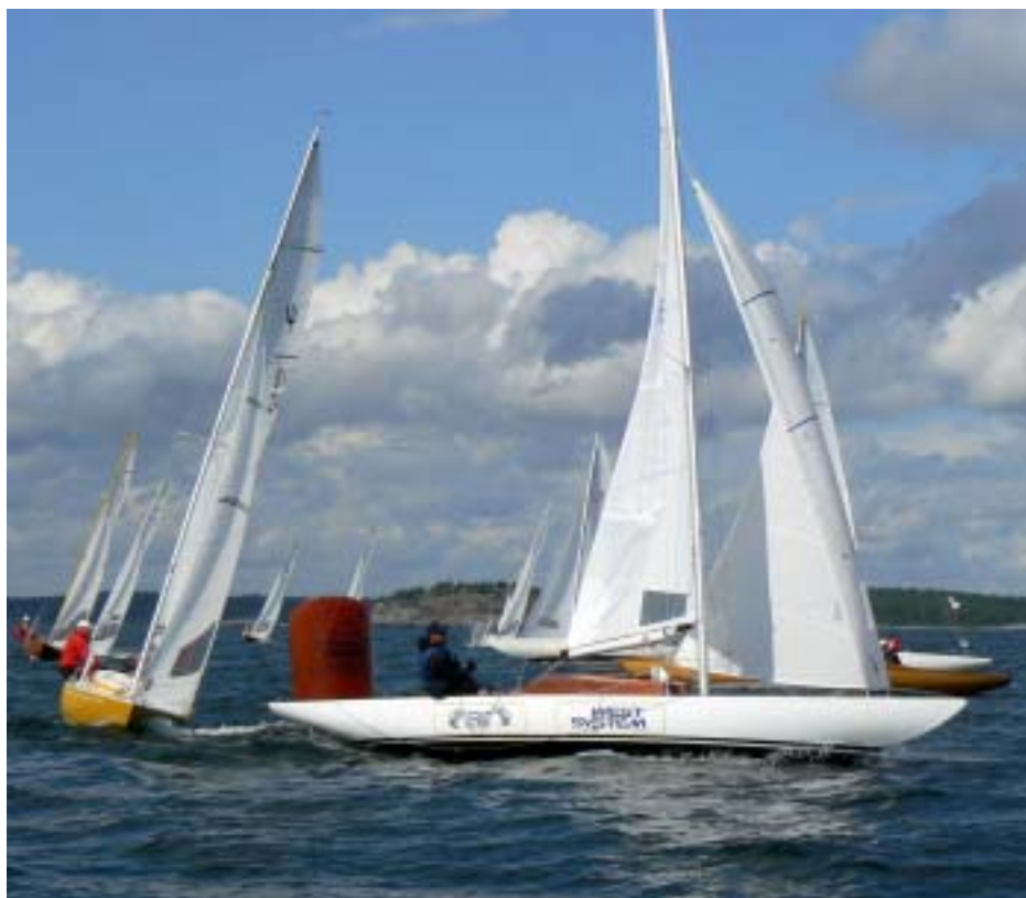
180 Kokett hittar vinnarspåret!