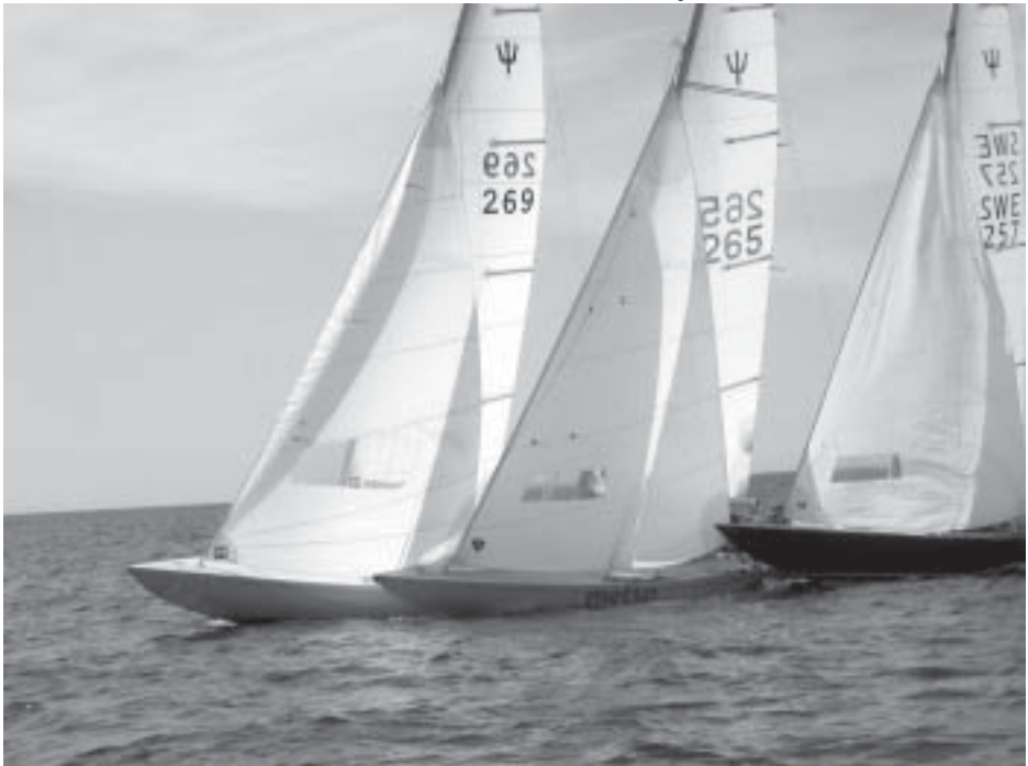
Tilltrasslat vid kryssmärket