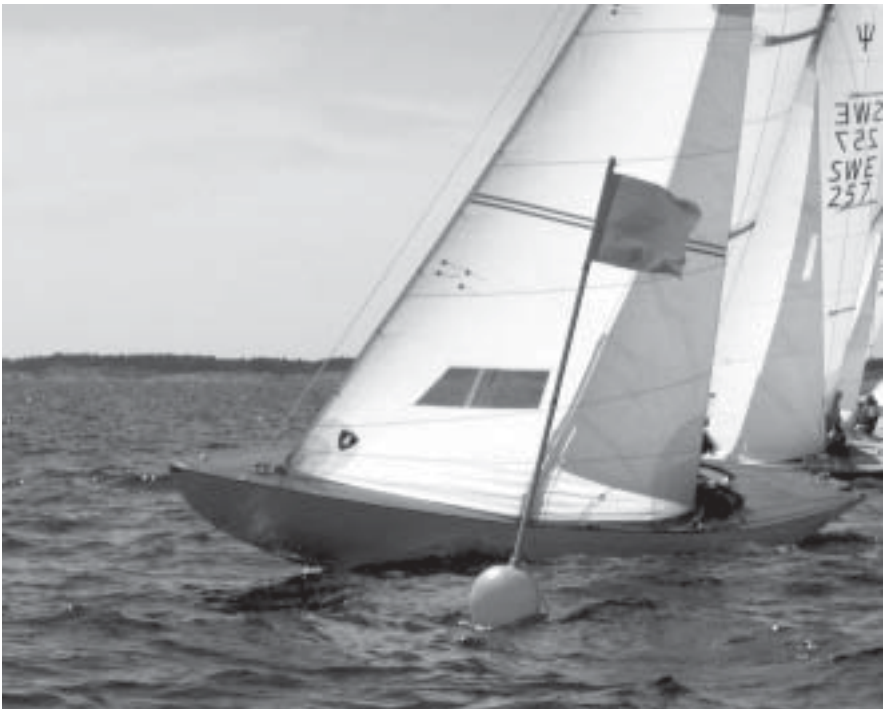
Lästart på Nepparpokalen.