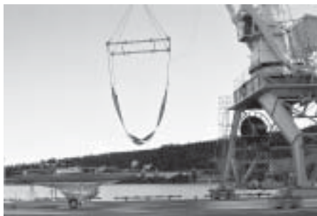
Kran “Gul Topp”

lite svårt att hitta kranen först! Vid hamnen för Ö-viks SS var den inte! (Inom parantes kan sägas att vid Ekolns Segelklubbs hamn vid Skarholmen har de skaffat en jättebra kran som tar 4 ton och som har elmotor med mjuk fin gång. Väldigt bra för båtar som kommer med trailer och vill vara med och kappsegla. Jag tyckte det var lite spännande att premiärlyfta Tonita där med den nyinstallerade centrumlyften av fyrkantströr som jag monterat i 39:an under våren ovanpå två bottenstockar och väl förankrad i de två nya 16 mm kölbultarna.) När jag väl hittat jättekranen och det var dags att lyfta med “gul topp” i Ö-vik så snurrade jag med fingret som tecken på att kranföraren kunde lyfta! Det kunde han verkligen! Det sade bara swopp och så var Tonita 3 meter upp i luften på två-tre sekunder. Så går det till när man lyfter med en sjåarkran för gods till stora lastbåtar, och centrumlyften fick därmed sitt verkliga elddop.