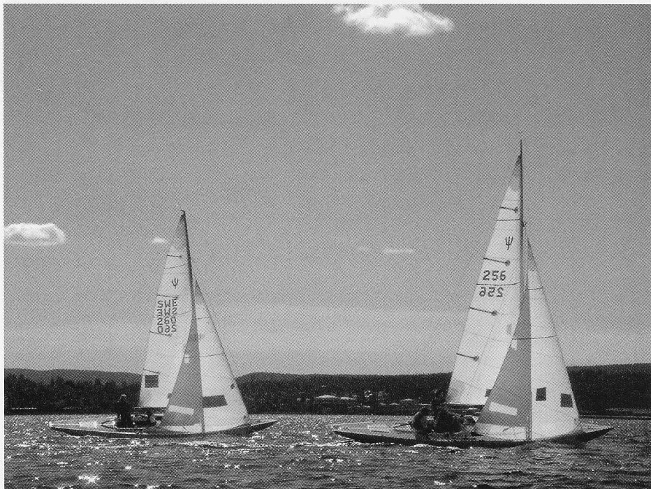
Pokalvinnarna i 260 samt blivande SM-tvåan i 256

Söndagen bjöd på sol och lätta vindar. Per-Arne och Mikael i 269 ångade på med en 3:e och 4:e plats och bärgade därmed en helt överlägsen SM-seger med ett avstånd till tvåan 256 Hellgren/Lundqvist på hela 18 platspoäng, trea blev Nisse Virving i 265.