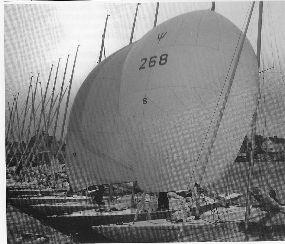
Är det det här som kallas bryggsegling?