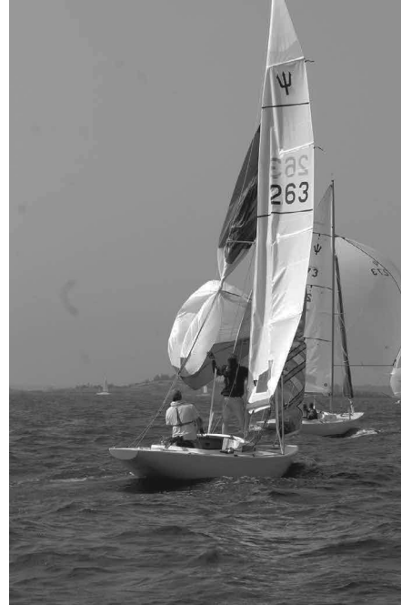
Spinnaker-strul kan man ha på många sätt.

I sista racet dag 1 inleder vi med att spinnfallet snor sig i genuan när vi ska rulla ut två minuter innan start. Vi hinner inte få ordning på strulet utan resultatet blir att vi får köra tredje racet utan spinnaker. Efter att återigen gjort en bra första kryss rasar vi tillslut ner till en 21:a plats. Det blir vår sämsta placering i regattan.