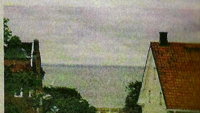
Neptunkryssare. Melian hustaken i Visby innerstad syns.