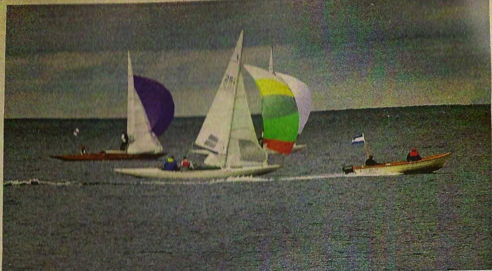
SM Igång. Neptunkryssar-SM avgörs utanför Visby hamn i helgen.