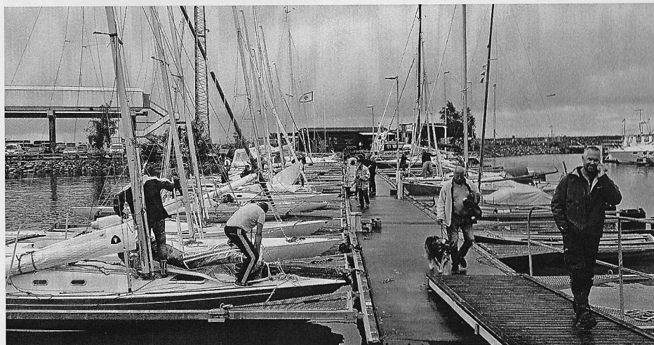
På bryggan i Visby. Wisby SS klubbhus och hamn ligger mycket centralt, mellan färjetterminalen och gästhamnen.