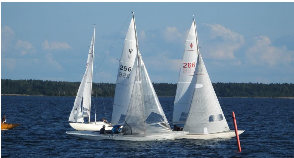
273 Svanen (och 170 Bonita)