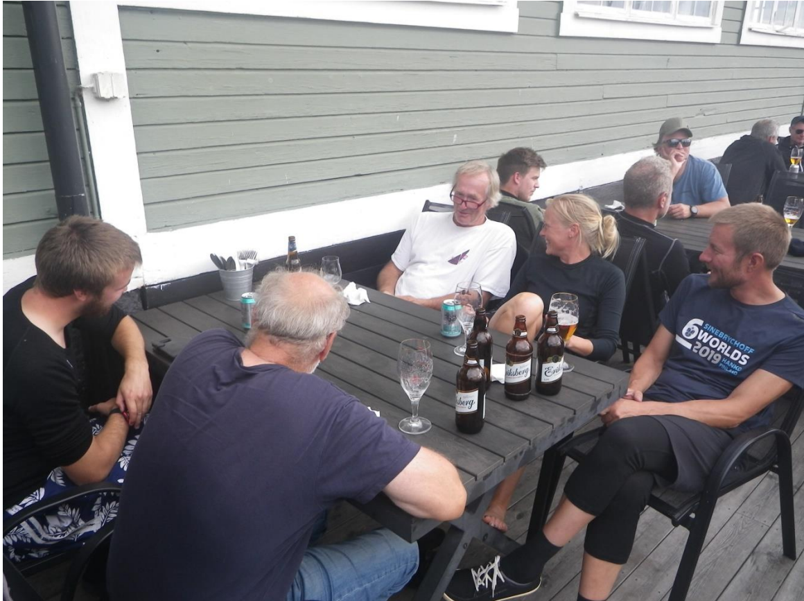
Bortförklaringar efter segling