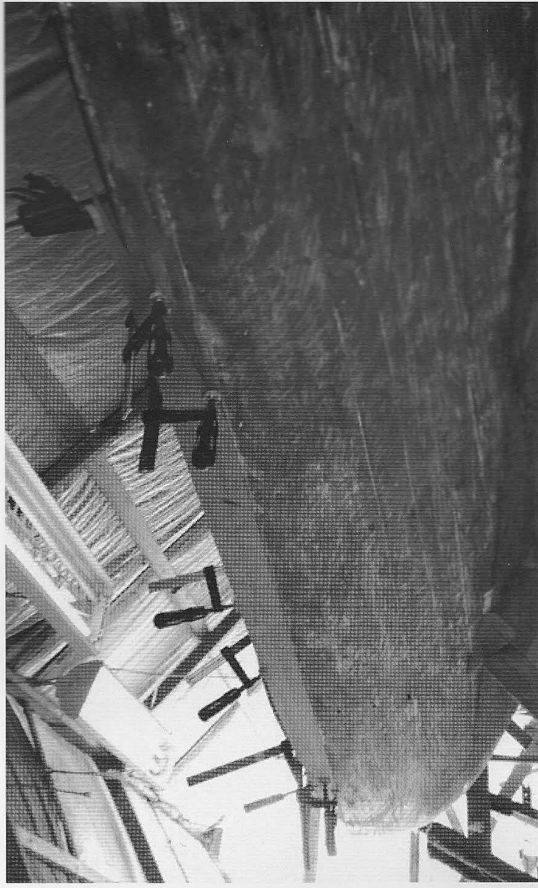
Bifogar en bild på de nya bottenborden som nu är monterade.