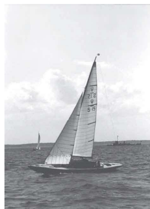
Med fock är segelytan 15 kvm, varför båten till att börja med kallades för 15 kvm skärgårdskryssare.

Syftet med sammanslutningen var, att förutom att stödja den billiga och sjödugliga