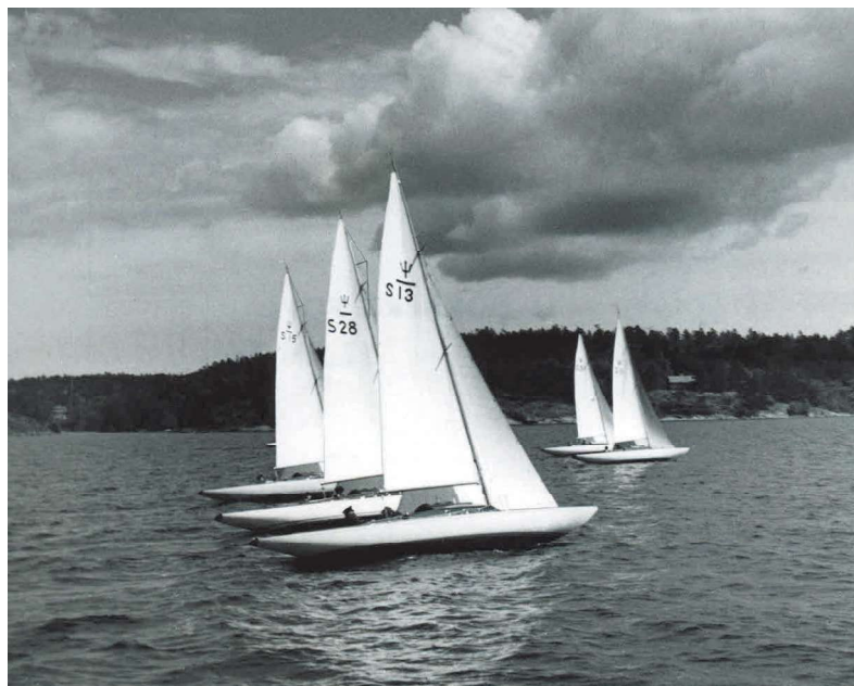
S 13 "Monica II", S 28 "Helene" och S 15 "Gullan VII" startar i KSSS juniregatta 1944. S 13 kom senare att exporteras till Italien där hon 1990-talet seglades av en amerikan anställd på IKEA.