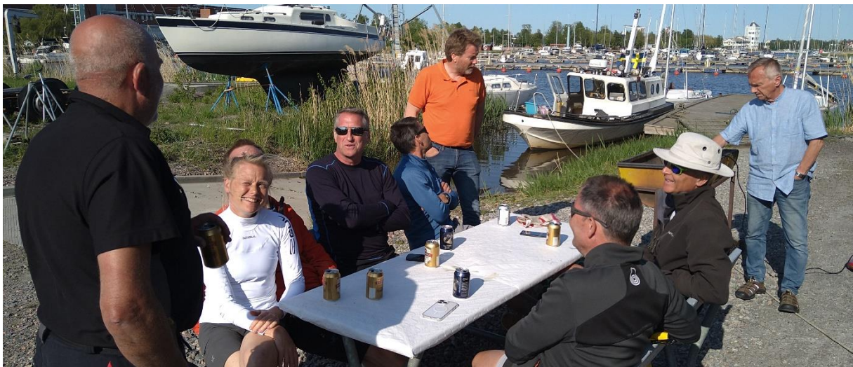
Grillning i solen.