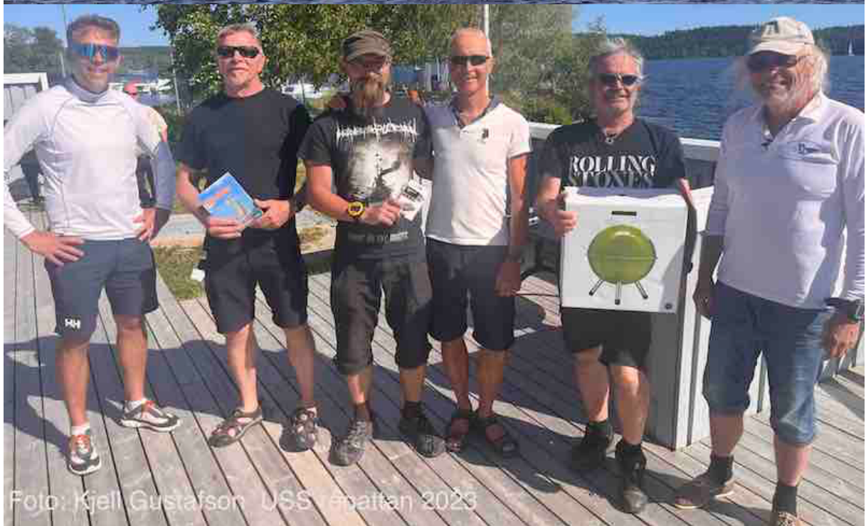
USS regattan 2023